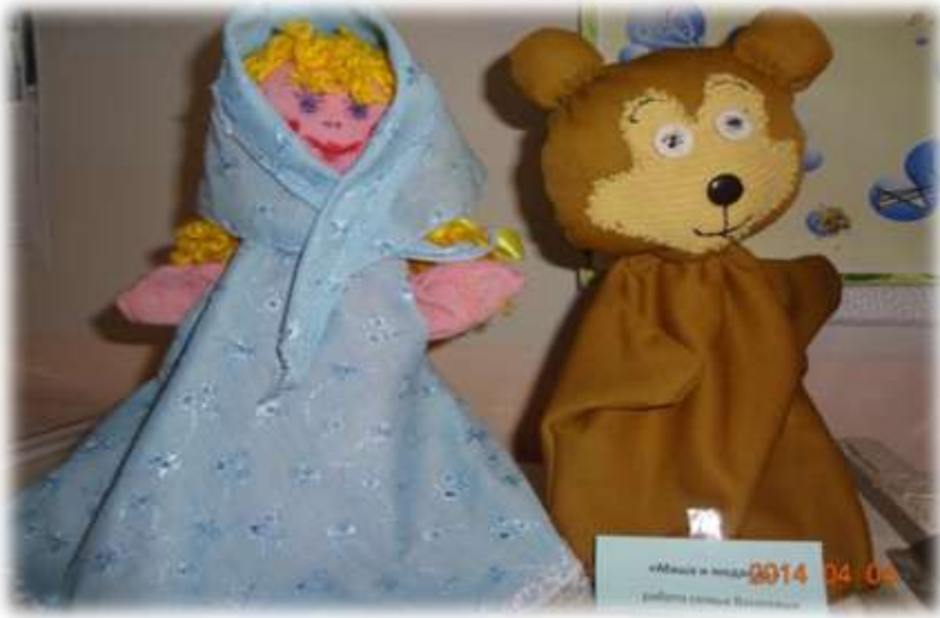
«Кукольный театр своими руками»